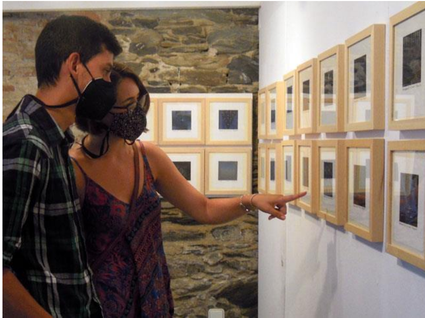
Exposició de Zbigniew Purczyński – 2021

Està organitzada per ADOGI, Associació Difusora de l'Obra Gràfica Internacional, una associació sense afany de lucre, i el Taller Galeria Fort. Tots dos reuneixen artistes i afeccionats a la pràctica i difusió del gravat i l'art gràfic d'arreu del món.