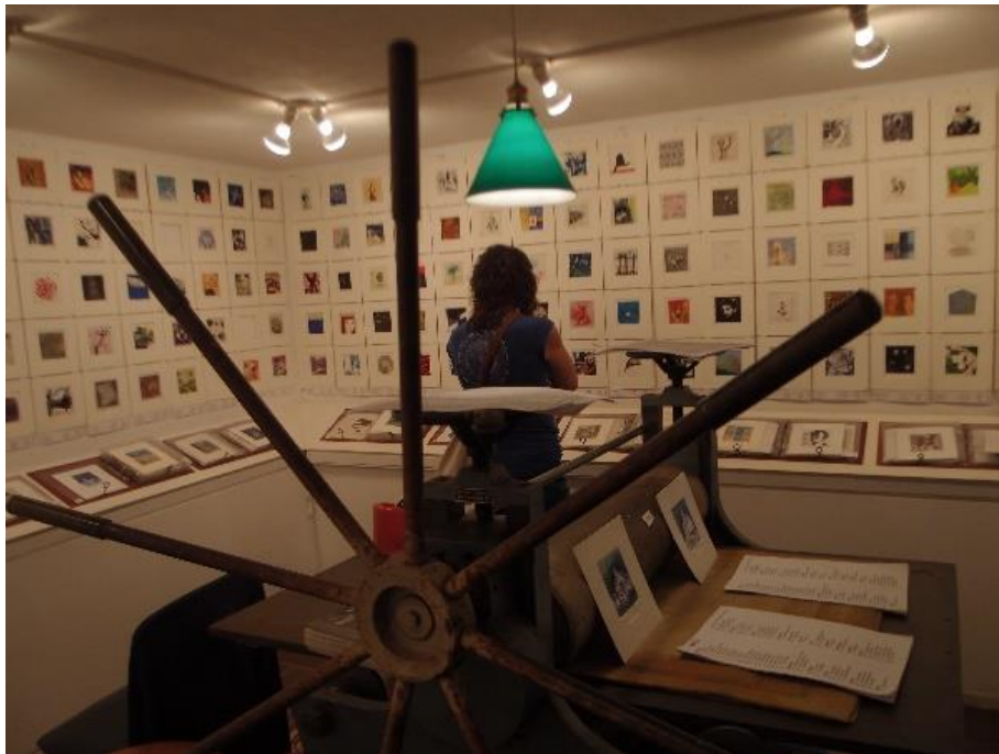
Exposició Miniprint Cadaqués. Edició 2020

—Naturalment. El fet que l'organització del Mini Print depengui enormement del servei de correus va ser un factor clau en el descens de participació. Els artistes que aconseguien fer els gravats (aquells que no necessitaven anar a un taller) es van trobar que no els podien enviar. Un desastre. I el públic, doncs, anava d'acord amb les diferents restriccions: segons s'anaven alliberant, més persones acudien a les galeries. No hem notat una gran davallada quant a l'adquisició d'obres, però, naturalment, tot en general ha anat "a menys".